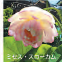
ミセス・スローカム